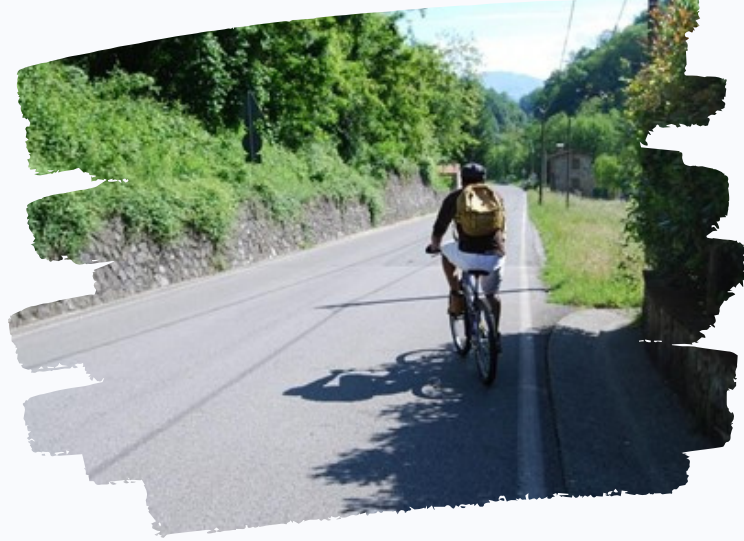
الأحداث الرياضية في OCC في برشلونة