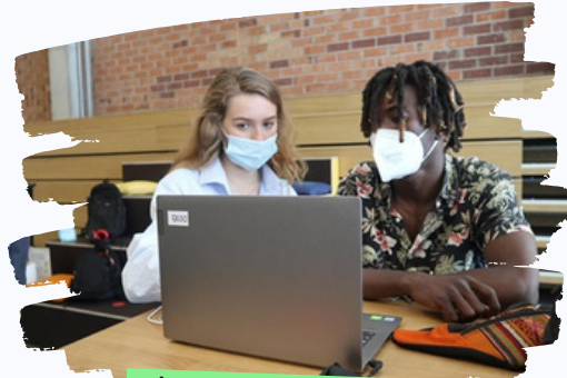
دمج تعلم اللغة للمهاجرين واللاجئين في Barcellona OCC

يتم إجراء تقييم مع بعض الضيوف لإمكانية إجراء اختبارات اللغة الإيطالية لتقييم المهارات اللغوية المكتسبة وفقاً للإطار الأوروبي المرجعي المشترك للغات (QCER).