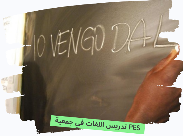
PES تدريس اللغات في جمعية

في إيطاليا ، تم إنشاء نظام التعليم للمهاجرين واللاجئين من خلال التعاون بين جمعية PES و CPIA المحلية (المركز الدائم لتعليم الكبار) ، مع بعض المعلمين داخل الجمعية وبعض المتطوعين. من خلال المقابلات الواردة ، يتم تقييم المهارات الأكاديمية الأساسية لكل مستخدم ، في محاولة لتحديد المسار الأنسب لكل منهم ، وتجنب حالات الإحباط والإبعاد من النظام "المدرسي" ، خاصة فيما يتعلق بالمستفيدين الحاصلين على مستوى تعليمي أقل في بلد المنشأ.